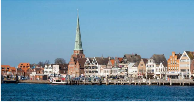
Unsere Stadt ...