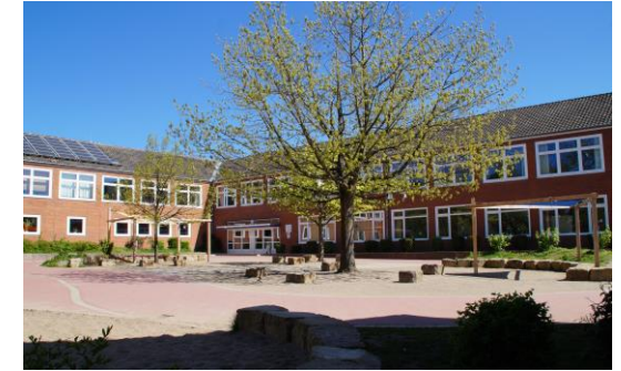
Unsere Gemeinschaftsschule ...